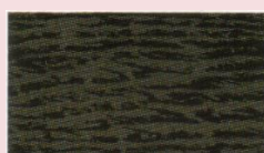
Gris al Alcohol/Agua