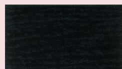
Negro al Alcohol/Agua